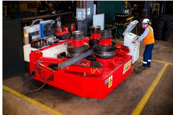
Roladora de perfiles hasta H8x40lbs/pie