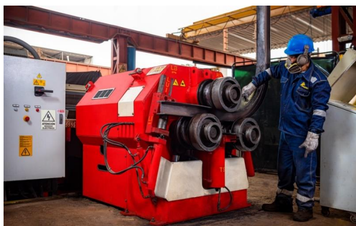
Roladora de perfiles hasta H4x13lbs/pie

Los perfiles H más usados en la fabricación de cimbras son: H4x13lbs/pie, H6x20lbs/pie, H6x25lbs/pie y H8x35lbs/pie. Tenemos los mejores equipos y maquinarias para satisfacer las necesidades más exigentes.