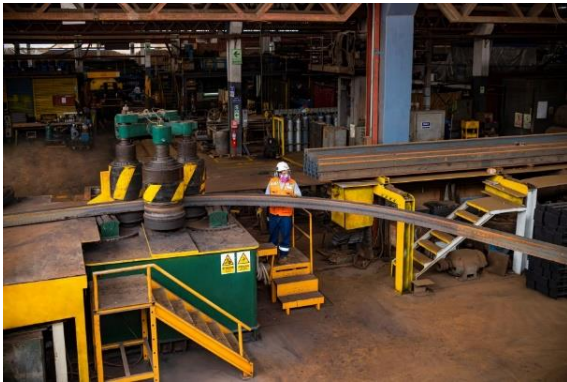
Roladora de perfiles hasta H6x25lbs/pie