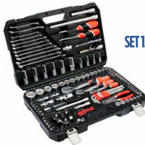
SET 126 PZAS