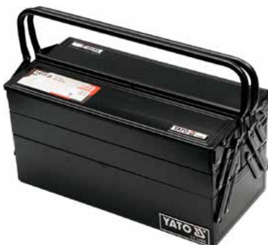
KIT 63 PZAS